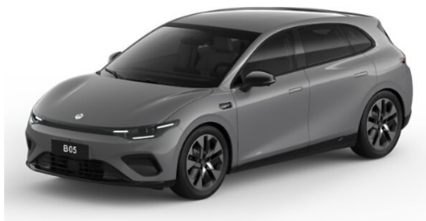
Windy Grey* OSA