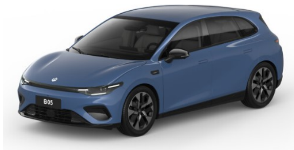
Starry Night Blue* OXC