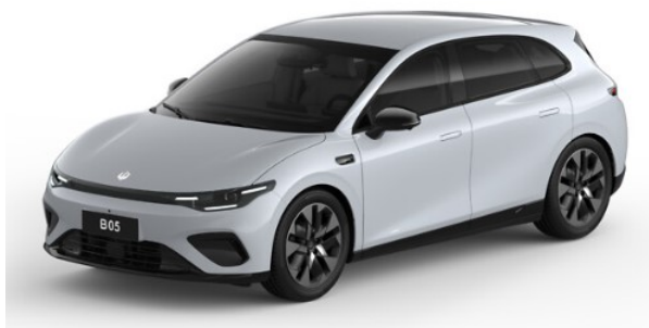
Galaxy Silver* ODS