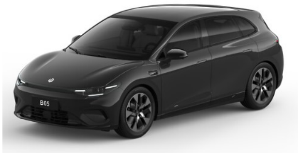
Metallic Black* OKL